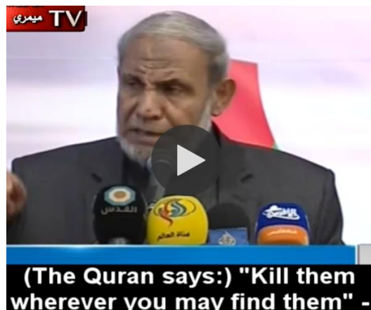
Afbeelding 9. Oprichter van Hamas Mahmoud Al-Zahhar op 8 maart 2017

Likoed Nederland hoopt dat dit Zwartboek tot voortschrijdend inzicht zal leiden in de berichtgeving van de NPO, zodat deze evenwichtiger wordt. Daar heeft het Nederlandse publiek en de Nederlandse belastingbetaler recht op. Ook de Joodse gemeenschap verdient dat.