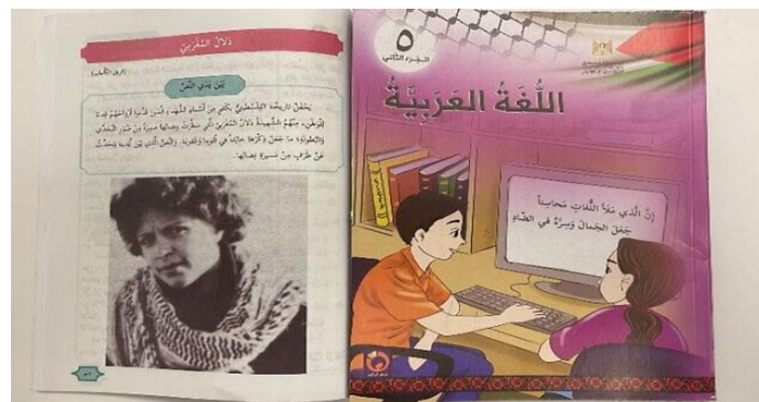
Afbeelding 6. Een schoolboek van de UNRWA voor groep vijf stelt Dalal Mughrabi als voorbeeld - een terroriste die 38 Israëlische burgers vermoordde, waaronder 13 kinderen.

22 april 2024. Volgens NOS is er volgens een rapport geen bewijs geleverd voor de verwevenheid van de UNRWA met Hamas . Dit klopt volstrekt niet. Deze kop en het artikel zijn zwaar misleidend anti-Israël, want in dit rapport is de band van de UNRWA met terroristen helemaal niet onderzocht. Die bewijzen zijn er wel. Deze waren ook al in het nieuws geweest. Elsevier checkt de bewering van de NOS en geeft wel een juiste weergave van die feiten van hoe het met de UNRWA gesteld is .