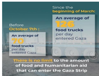
Afbeelding 3.

24 maart 2024. Hongersnood is altijd verschrikkelijk. Echter, zelfs volgens de VN komt de honger in Gaza pas op de veertiende plaats wereldwijd. Toch meldt de NOS die honger keer op keer prominent. Sinds 7 oktober noemt NOS.nl de hongersnood in Gaza 63 keer. De 13 ergere hongersnoden echter gemiddeld slechts 1 keer (Haïti 8 keer, Zuid-Soedan 2 keer, Afghanistan, China, Jemen en Oekraïne elk 1 keer). In de bij dit item behorende uitzending van Nieuwsuur werd ook sterk gesuggereerd dat Israël welbewust Gazanen zou willen laten verhongeren, zoals de titel aangeeft: " Honger als wapen? " Als bewijs wordt een uitspraak van de Israëlische minister van Defensie opgevoerd, in de emotie twee dagen na de pogrom van 7 oktober. Deze rapportage komt ruim vijf maanden later. Dit was toen uitdrukkelijk geen Israëlisch beleid. Er werd dus welbewust karaktermoord gepleegd op de Joodse staat. Het Israëlische standpunt dat het genoeg voedsel doorlaat , net zo veel als voor 7 oktober, wordt niet geloofd. De NOS verkondigt zelfs zonder bewijs dat Israël stelselmatig zou liegen over de voedselvoorziening . De kop van het artikel luidt: " Israël komt met leugen na leugen over voedselsituatie Gaza ". Deze beweringen komen dicht bij de recycling van aloude antisemitische beschuldigingen - over de leugenachtigheid en de wreedheid van het Joodse volk. Een verzoek van Likoed Nederland om aanvullende wederhoor van Israël werd door zowel de redactie als de NPO-ombudsman afgewezen.