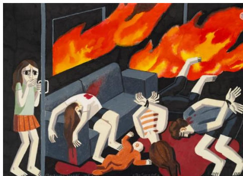
Afbeelding 1. Artistieke weergave door Zoya Cherkassky van de pogrom

7 november 2023. De NOS stuurde geen journalist naar de vertoning van de authentieke beelden van de pogrom van 7 oktober , ondanks dat de NOS verreweg de grootste redactie in Nederland heeft.