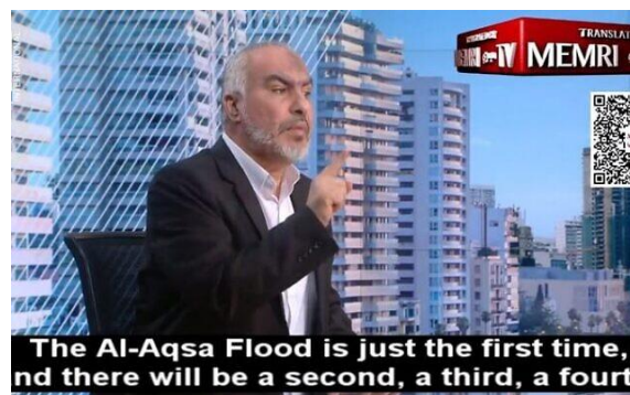
Afbeelding 4. Hamas leider Ghazi Hamad op 24 oktober 2023

26 maart 2024. Een VN-rapporteur beschuldigt Israël van genocide en bewuste executies . Er wordt niet vermeld dat deze VN-rapporteur een anti-Israël agenda heeft en een bewezen antisemiet is. Zij wordt daarom niet serieus genomen door onder ander de Verenigde Staten, Frankrijk en Duitsland. Zij heeft Hamas niet van genocide beschuldigd, terwijl Hamas die uitdrukkelijk wel wil plegen en daarom massaal burgers afslachtte op 7 oktober. Hamas heeft aangekondigd dat zij die aanvallen willen herhalen totdat Israël vernietigd is. Volgens het internationaal recht is Israël verplicht om daartegen op te treden .