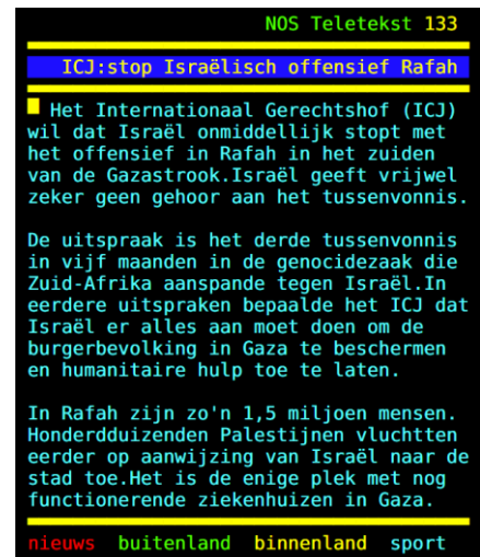
Afbeelding 8. NOS Teletekst 24 mei 2024

24 mei 2024 . De NOS meldt dat Israël het offensief in Rafah direct moet stoppen van het Internationaal Gerechtshof. Bijvoorbeeld CNN meldt echter dat de uitspraak anders uitlegbaar is . Onder de voorwaarde dat Israël zich houdt aan het oorlogsrecht en de genocide-conventie, kan Israël het offensief voortzetten. Dat is de uitleg van vier van de vijf rechters die een nadere toelichting hebben gegeven. Deze essentiële informatie wordt niet bericht.