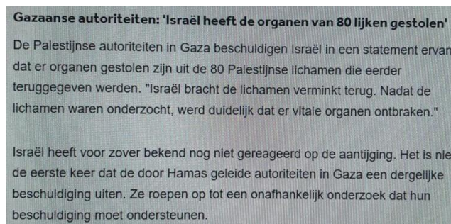
Afbeelding 2. Middeleeuws bloedsprookje bij de NOS

26 december 2023. De NOS meldt dat Israël orgaanroof zou plegen bij dode Palestijnen . Het is de moderne versie van het Middeleeuwse bloedsprookje. Daarin werd beweerd dat Joden niet-Joden doden om hun lichaam te misbruiken. Op basis van dit antisemitische sprookje zijn duizenden Joden vermoord. Ook deze informatie komt van het aan Hamas gelieerde Euro-med. Dat werd niet vermeld. Het bericht wordt later verwijderd.